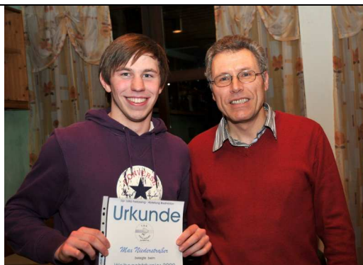
Weihnachtsfeier nach dem Nikoloturnier 2009 der Badminton Jugend

Gemeinsam mit dem Jugendvorstand werde ich (so gewünscht) das Mandat weiter erfüllen, also weitermachen. Es ist schon rein aus finanziellen Überlegungen (Zuschüsse!) für den Verein wichtig, eine Jugendorganisation zu haben – zahlreiche Vereine haben aktuell nicht einmal diese.