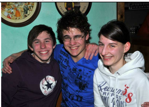
Weihnachtsfeier nach dem Nikoloturnier 2009 der Badminton Jugend